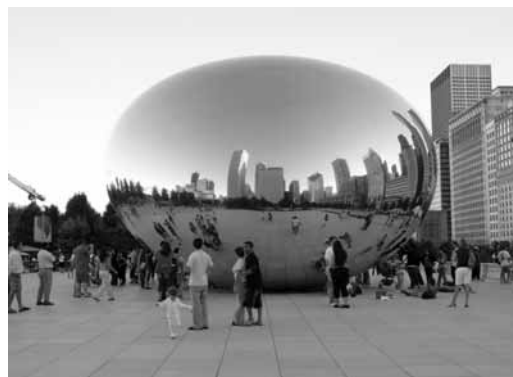
Cloud Gate. Millennium Park. Chicago.