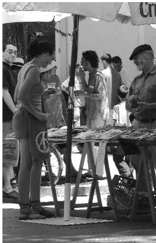
Mercadillo Cultural del Pumarejo (Sevilla).

net en algunas plazas suponen una actualización de sus capacidades como nodos en los que obtener información y conocimiento. Asimismo, hay muchas posibilidades en la dinamización del espacio público de los tejidos históricos como espacio lúdico, didáctico, escénico, expositivo, etc. Pero la generación de nuevas funciones debe superar la reproducción de iniciativas más o menos exitosas como estas e incluir grandes dosis de originalidad en la comprensión de la idiosincrasia de cada caso, de las funciones y características de sus entornos privados, o de la limitación o no que determinados entornos monumentales plantean de cara a la programación de contenidos. Así pues, la revisión de la propia concepción de los espacios públicos y de su relación no sólo con equipamientos, sino también con espacios y actividades privadas, podrá ser una oportunidad muy interesante. A menudo, los segundos quedan relegados a usos de restauración y similares, pero también cabe repensar el papel de otros comercios estrechamente ligados al papel central de los tejidos históricos. Por ejemplo, el caso del comercio del libro, que por su propia naturaleza ofrece una buena oportunidad de interacción y dinamización de los espacios libres inmediatos (GARCÍA, 2005), similar a la de espa-