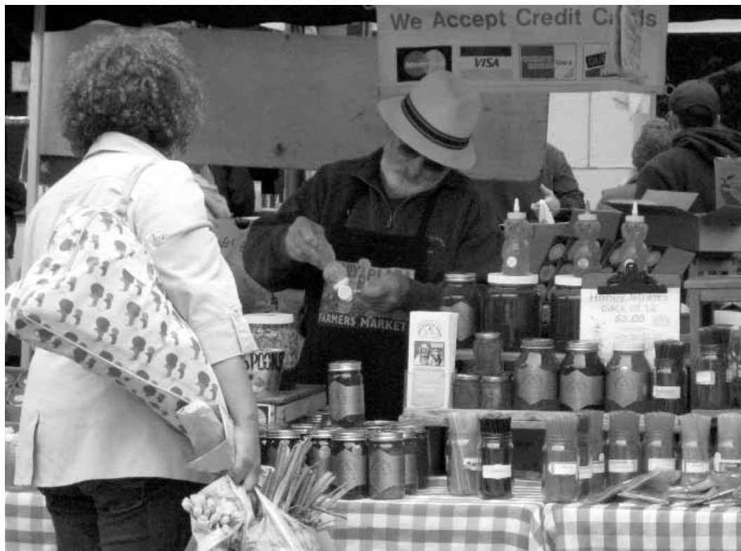
Honey stall at the Farmer's Market, Ferry Building (California).

París o cualquiera de los mercados semanales de alimentos en Londres ponen de manifiesto el atractivo que mantienen estos usos. En esta línea, las experiencias de farmers markets en Estados Unidos ponen en evidencia el atractivo dual de estos usos: como espacios de integración social y como vehículo para la subsistencia de un pequeño comercio local.