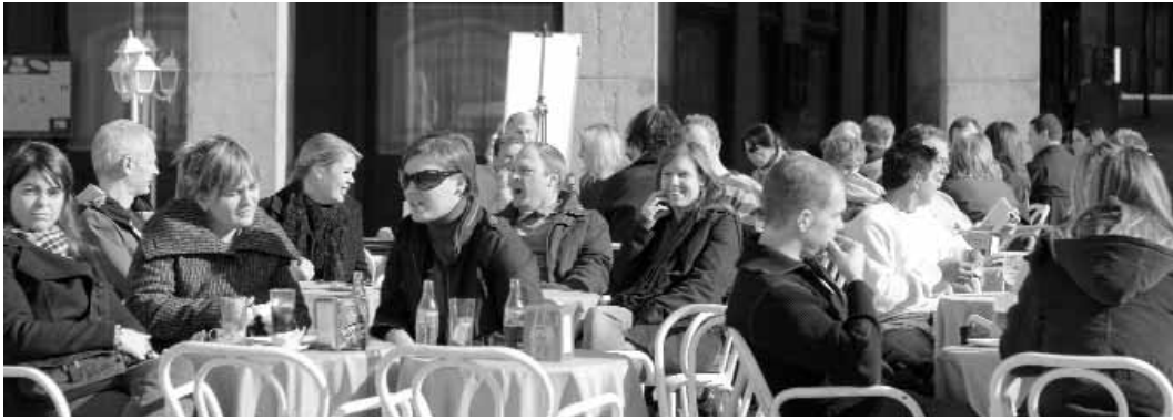
Warm winter.