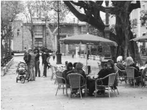
Plaza de Mina, Cádiz.