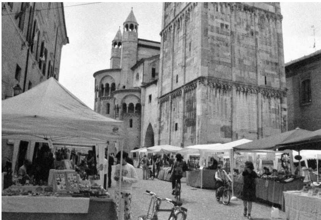
Módena (Italia), entorno de la Piazza Grande.

nos , propios de la ciudad dispersa, con otros movimientos centripetos que valoran la ciudad tradicional, compacta y multifuncional. Una tendencia ésta que está afectando no sólo al plano de la investigación, sino también a la planificación y gestión de los espacios históricos y al propio plano inmobiliario, con un creciente interés en los centros históricos. No obstante, este proceso no está exento de conflictos. Conflictos que son parte esencial de la propia historia de las tramas urbanas tradicionales y de su redefinición secular. Así, esta centralidad a menudo se ha traducido, por el propio devenir reciente de la ciudad histórica o por la ordenación y gestión de la misma, en una zonificación de sus funciones y en la correspondiente simplificación de la multidimensionalidad del uso de los espacios públicos. Asimismo, ha propiciado no sólo la aparición de espacios de competencia, como centros comerciales cerrados y abiertos, que están adquiriendo el papel de los espacios públicos en un contexto urbano caracterizado por la movilidad privada, los nuevos valores sociales y políticos y las menos explícitas jerarquías de poder (STEVEN, 1999), sino también la difusión de los llamados placelessness (RELPH, 1976) en tanto se pierden significados mientras se generan espacios o paisajes urbanos homogéneos y estandarizados (AREFI, 2004; CARMONA et ál., 2003).