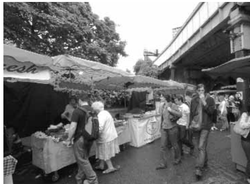
Mercado dominical en Londres (Londonbridge).

cuidado de la escena urbana o de ampliar los contenidos de las placas informativas a estos casos y no sólo a los hitos monumentales.