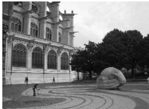
Arte público junto a la iglesia de Saint Eustache, en Les Halles, París.