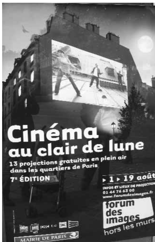
Programa de cine al aire libre en París.