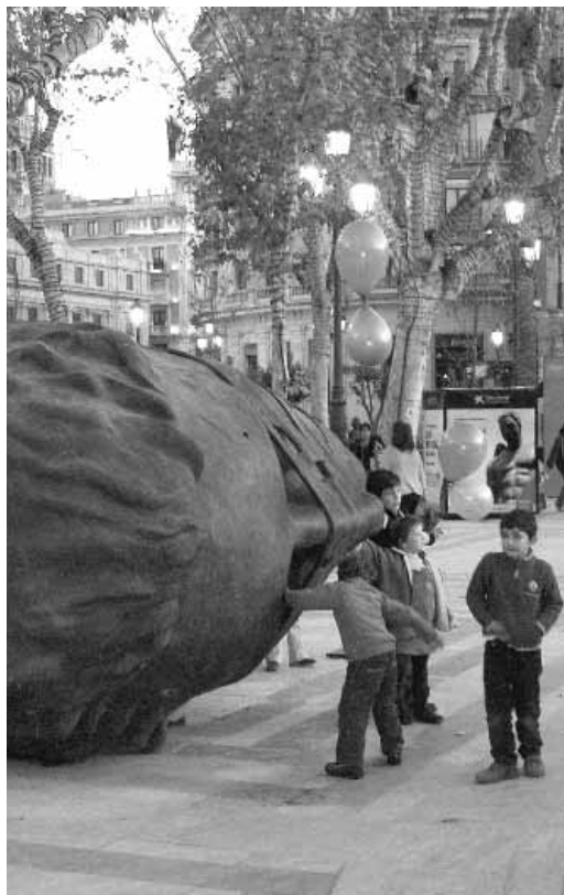
Plaza Nueva, Sevilla.

En el plano netamente urbanístico, la amplia red de intersticios que suele caracterizar a las tramas históricas, sobre todo en aquellas ciudades en las que la organización secular se ha visto parcialmente afectada por procesos de reforma interior, tiene un valor implícito como testigo de estos distintos modos de organización física y social de la ciudad. Un valor que se mantendrá en tanto se sea cuidadoso con la autenticidad de la morfología y de la toponimia de los espacios públicos. Por ello, tiene sentido el debate arquitectónico de los últimos decenios sobre la idoneidad de los materiales y de los elementos compositivos, no sólo en los ámbitos monumentales, sino también de los significados históricos sobre los que se sustentan las intervenciones en entornos menos exigentes en este sentido (POL, 1998). No obstante, no menos importante son los potenciales identitarios o didácticos derivados de la particular naturaleza de estos espacios públicos y, en relación con ello, la idoneidad del