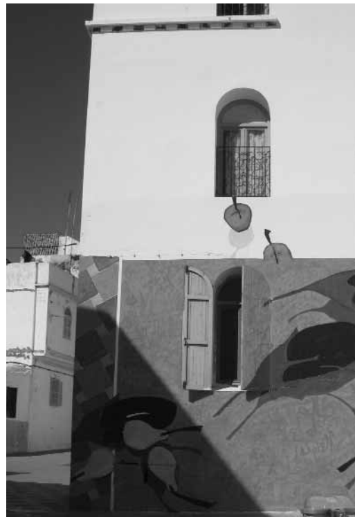
Murales testigo de la estrategia de promoción turístico-cultural en Asilah, Marruecos.

Esto lleva a la necesaria consideración de tres aspectos clave: la diversidad de los espacios públicos, el carácter de los mismos como sistema complementario y la importancia de lo local para su desarrollo. En relación con los dos primeros es preciso tener en cuenta que el espacio público de la ciudad es un sistema territorial y por lo tanto conformado por nodos y redes; pero también un sistema complejo por su papel en los aspectos más elementales